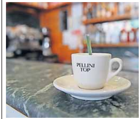
Kenner schleudern ein „kaffä“ über den Tresen, andere bestellen Espresso. RUMPF

go sind sie ja gewohnt, dass man Deutsch spricht. Und auch wenn die Aussprache genau richtig war, passiert es, dass der Kellner sich erkundigt – „caffé liscio?“, glatter, einfacher Kaffee also. Denn im Norden wird der Espresso oft macchiato getrun-